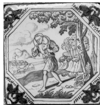
Der gute Hirte