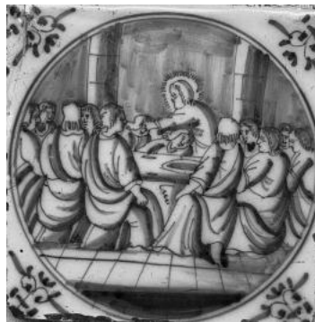
Bibelfliese mit Merian-Bibel-Motiv