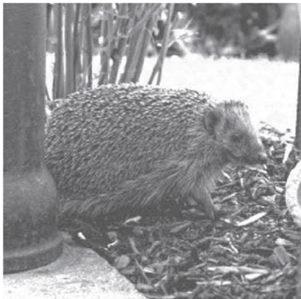
Ein igelfreundlicher Garten macht Freude.