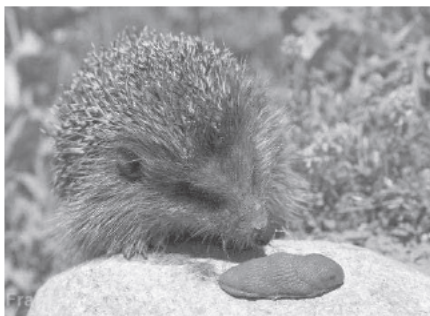
Ein Igel im Garten ist der natürlichste Schneckenenschutz.