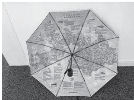
Ansicht innen: Karte Basel-Landschaft