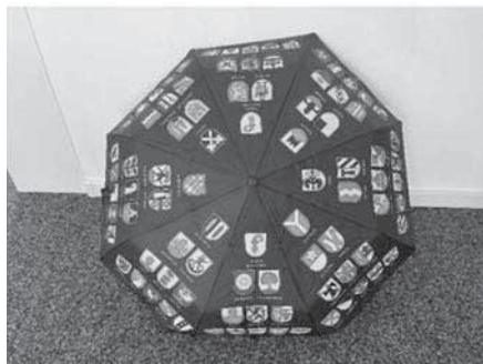
Ansicht aussen: 86 Gemeinden mit Wappen

Falls Sie Interesse haben, können Sie diesen Schirm bis Ende Juni 2024 auf der Gemeindeverwaltung für CHF 47.– bestellen.