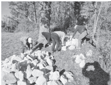
Steinhäufenbau beim Plattenhölzli