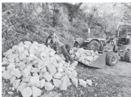
Steintransport