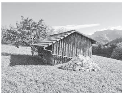
Steinhäufen beim Holderstöckli

Die „Stiftung zur Förderung der Kleinkarnivoren“ hatte vor einigen Jahren zusammen mit dem Ebenrain-Zentrum ein Projekt lanciert, um insbesondere die Populationen von Hermelin und Mauswiesel schweizweit zu sichern. Der NVVT hat sich seitdem in diesem Projekt engagiert. Wir verbessern und vernetzen die Lebensräume für Wiesel und leisten so einen tatkräftigen Beitrag zur