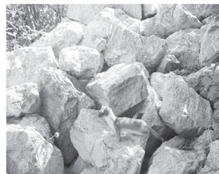
Hermelin auf Steinhäufen beim Stängelacher

Förderung der Biodiversität in der Gemeinde. In der Hecke beim Stängelacher, und entlang dem Zülmattbächli wurden vom NVVT in den letzten zwei Jahren schon einige solche Steinhäufen errichtet. Die Wiesel haben sie bereits in Besitz genommen.